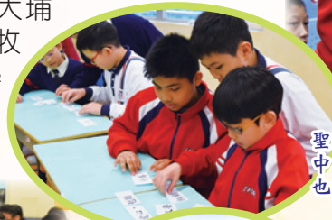
聖經問答比賽中，金句排序也難不到同學