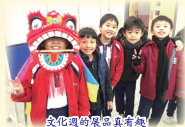
文化週的展品真有趣