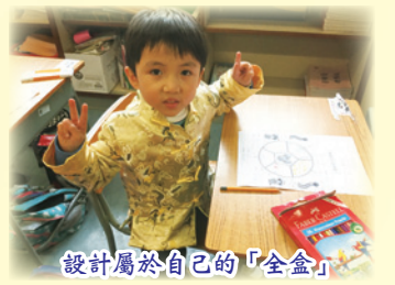
設計屬於自己的「全盒」