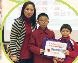
同學在問答比賽展示努力的成果