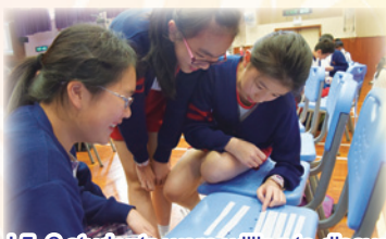
J.5,6 students were willing to discuss with their groupmates in English.