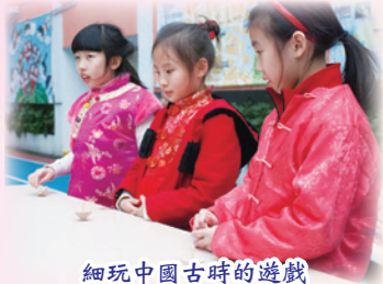
細玩中國古時的遊戲