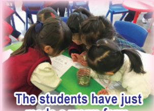
The students have just made a worm farm.

J.1 students read the big book 'How to make a Worm Farm'. Then we organized for our J.1 students to visit the organic garden next to our school to look for worms to make a real worm farm. The children were very excited and we hope to do more outdoor learning activities soon.