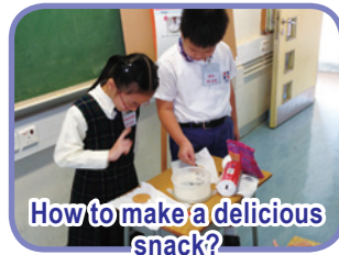
How to make a delicious snack?