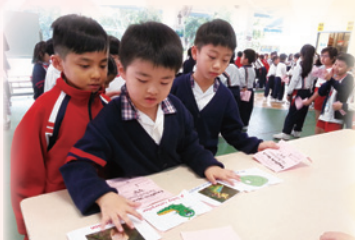
J.1,2 students enjoyed playing fun booth games very much.

To introduce the famous authors, a book exhibition was held and all students had a chance to read these great works. Moreover, J.1-2 students played fun booth games related to selected picture books. J.3-6 students read the books of Alice in the Wonderland and Fantastic Mr fox, and watched their movies in TPMS cinema. Students all enjoyed discussing with their group members and sharing their creative ideas based on the movies. We all hope that our students will love to read and start to read after participating in all the fun reading related activities in our English Week!