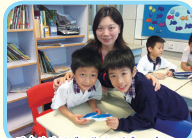
聽完姨姨說《小熊的小船》，我們一起摺隻小船出海遊歷