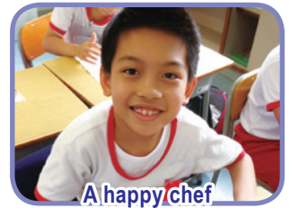
A happy chef