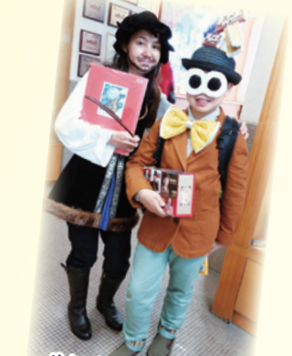
你知道我們扮演誰嗎？