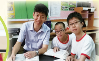
同學們都認真參與查經活動