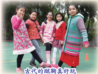
古代的蹴鞠真好玩