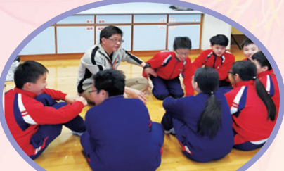
大埔堂的弟兄姊妹與同學們討論信仰問題