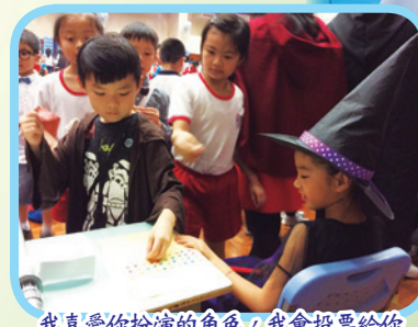
我喜愛你扮演的角色，我會投票給你