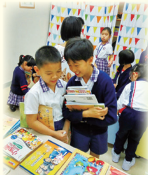
舊書新主人活動讓學生學會珍惜及分享