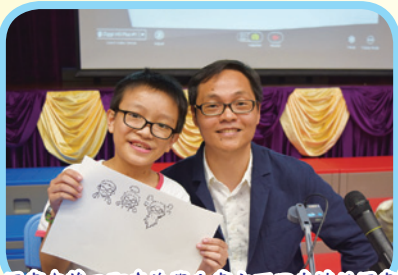
漫畫家草日即席為學生畫出不同表情的漫畫