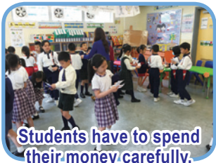
Students have to spend their money carefully.

To help our J.3 students learn to read and follow cooking instructions in a fun way we made funny face biscuits – we hope the children may learn about cooking and imaginative ways to make fun snacks.