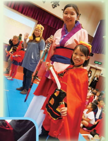
大家不約而同，一起打扮成花木蘭