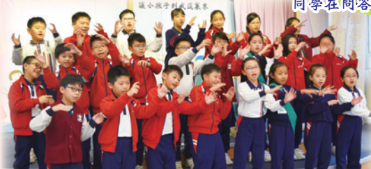
全班合唱時，我們都使出渾身解數