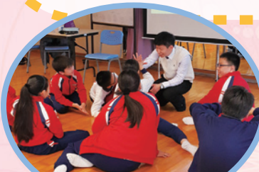
王 SIR 與同學們進行信仰分享