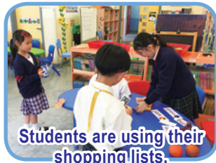
Students are using their shopping lists.