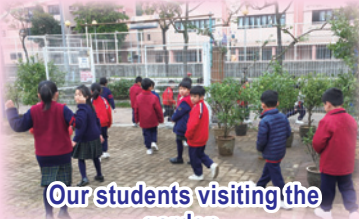
Our students visiting the garden.