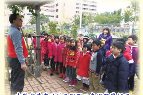
中藥有甚麼功效？問問二年級同學們吧