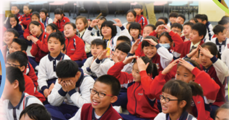
詩歌分享會中，我們都樂在其中