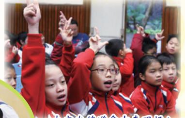
大家在佈道會中表現投入