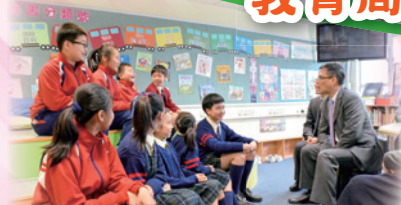
看，小朋友能和副局長交談，多雀躍！