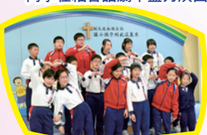
大家明白我們分享的信息嗎？