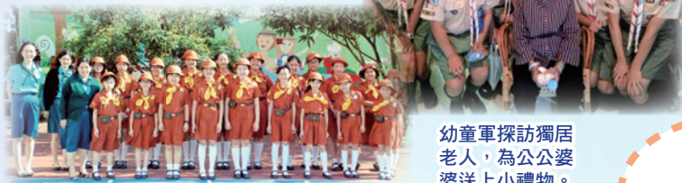
幼童軍探訪獨居老人，為公公婆婆送上小禮物。