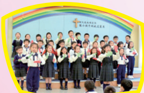
同學盡情與其他同學分享詩歌。