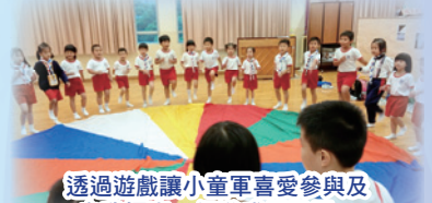
透過遊戲讓小童軍喜愛參與及自我探索，促進成長發展。