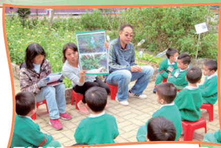
原來小故事可以教曉小朋友珍惜地球資源，綠色種子早已埋藏在孩子心中。

學校一向重視家校合作及推行各項環保活動，並著重「先教育、後行動」的理念，價值與實踐之結合，藉以培育綠色的新世代。學校曾舉辦不同形式的回收活動：如舊衣、電腦、電器、膠瓶、月餅盒、廚餘等，讓我們認識到循環再造及循環再用的重要性。