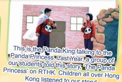
This is the Panda King talking to the Panda Princess. Last Year, a group of our students told this story, 'The Panda Princess' on RTHK. Children all over Hong Kong listened to our story!