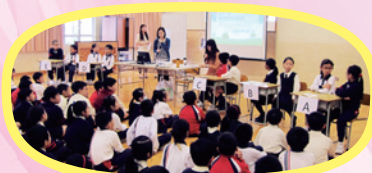
同學們認真參與聖經問答比賽。

一眨眼就六年了，小學的生涯也所餘無幾。今年是我最後一年在學校參與「福音期」，所以，對我而言就是最富意義的。今年學校也安排許多活動，令我印象最深刻的是詩歌分享。這個活動令我可以多親近天父和增加了與同學的友情。我希望以後升上中學後也能有機會與人分享詩歌。