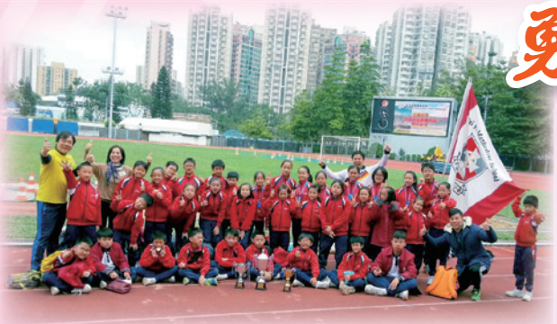
我校陣容鼎盛的田徑隊。

作為一位出色的田徑運動員，必須接受艱苦的訓練，持之以恆，才可達到理想的效果。本學年的田徑隊員都投入及珍惜每一次訓練，希望以最佳的實力展示自己的訓練成果，與其他學校的運動員互相切磋。