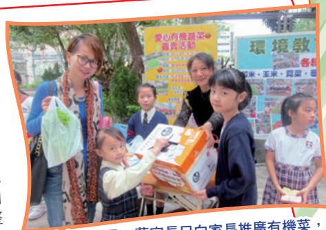
團結家校力量，藉家長日向家長推廣有機菜，既能為山區孩子的學習籌款，又可提昇孩子服務精神，真是一舉兩得。

本校的種植園，裏面種有不同的蔬菜、水果、甚至是藥材，真是包羅萬有！不僅讓孩子可以認識到不同品種的植物，還可以讓他們有機會體驗到農夫艱辛的種植過程，這些都是小孩子從書上學不到的知識。因此，我很樂意和其他家長義工和老師，付出精神和時間去整理、照料及關心種植園內的事務。同時，因為大家的努力，種植園的各種植物都生長得很健康，真是值得為我們的努力而驕傲啊！