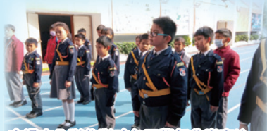
交通安全隊集隊時各同學都非常專注。