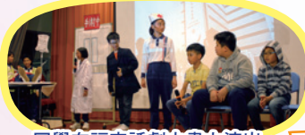
同學在福音話劇中盡力演出。