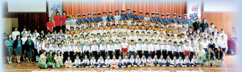
我校制服團隊隊伍眾多，能讓學生發展不同潛能，健康成長。

黃重光博士熱心教育，為鼓勵學生關心社會，熱心服務，特別設立制服團隊成員獎學金，以表揚在制服團隊有傑出表現的成員，希望能鼓勵更多同學參與制服團隊及發展同學不同的潛能。