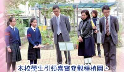
本校學生引領嘉賓參觀種植園。