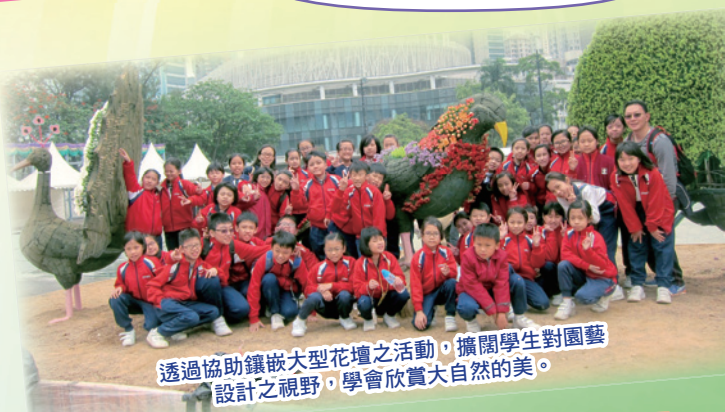
透過協助鑲嵌大型花壇之活動，擴闊學生對園藝設計之視野，學會欣賞大自然的美。

常聽到許多人說：「我會做環保！」是呀！環保的口號是人人會喊的！但是我們真的能實際做到嗎？也有人認為，環保的行動對一個人來說，實在是太大了！但是，我相信「聚沙成塔，滴水穿石」的道理；其實，若個人從生活上的細節開始，逐步推廣至工作以及社區上，一個人的小小行動是很寶貴的。因為這樣可以幫助身邊人開放心靈、放眼世界及建立綠色思想，從而懂得尊重自然及環境，以培養學生對保護環境的責任感，並能夠作出愛護大自然的行為。我相信，學校透過舉辦多元化的環保活動，將綠色生活概念植根孩子心中。如果每個人都能夠確實去實踐「環保」的話，生活一定會更好。