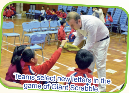
Teams select new letters in the game of Giant Scrabble.