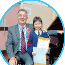
在音樂節鋼琴獨奏比賽中勇奪冠軍及獲頒榮譽獎。