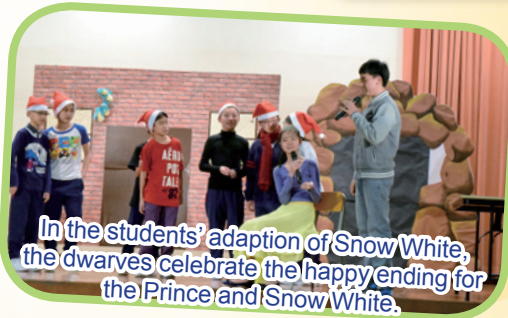
In the students' adaption of Snow White, the dwarves celebrate the happy ending for the Prince and Snow White.