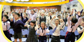
同學在佈道會中投入活動。

在福音期的聚會中，教會藉著福音話劇讓同學們明白「復活」的意義。同學在福音期決志翌日，教會隨即舉辦信仰跟進活動，讓同學在輕鬆的氣氛下明白信主的意義。