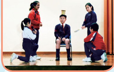
同學們都認真製作道具，使演繹的人物更維肖維妙。