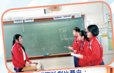
在班際話劇比賽中，同學們都全情投入地扮演故事人物。

本年度，普通話科也與中文科協作。在早會及午膳時段，更增設中華文化廣播，講述有關涼茶、中華美食及寓言故事，讓同學在學習中華文化的同時，更能訓練普通話的聽說能力呢！