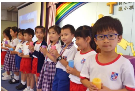
小一啟蒙禮 一同領受上帝的祝福