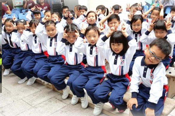
大埔堂收割節、母親節獻唱 學會心存感恩