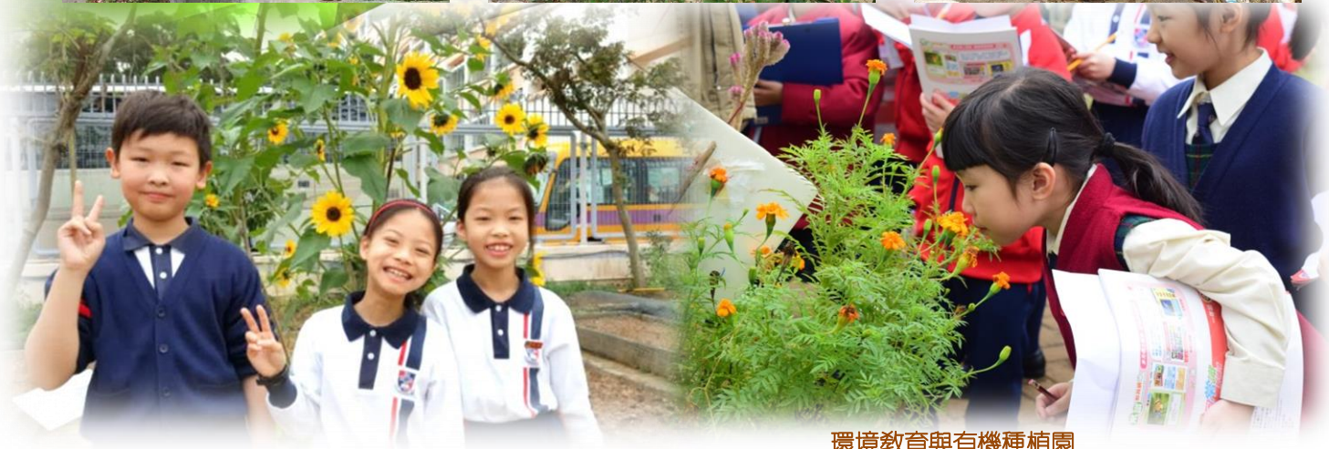
環境教育與有機種植園