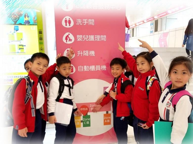
全方位校外學習 親身體驗與探究