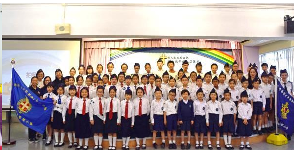
宗教制服團隊 做個聽道行道的小信徒