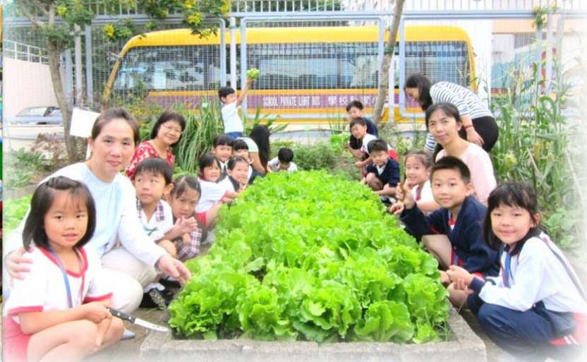
種植體驗活動 實踐綠色生活