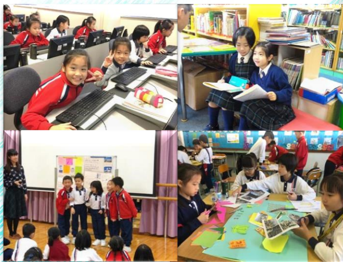
跨學科專題研習 靈活學習 共享成果