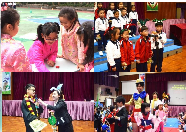
中華文化週 趣味英語週 世界閱讀日 活現書中人