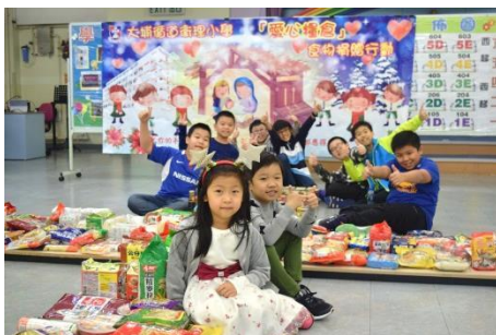
聖誕崇拜暨愛心糧倉活動 施比受更為有福