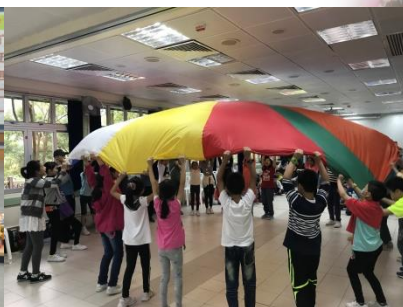
福音成長營 輔助孩子主內成長